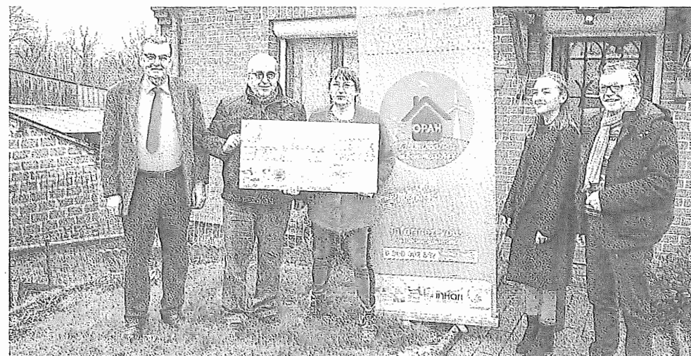
Les Campagnes de l'Artois ont participé à hauteur de 839 euros.

Une OPAH (opération programmée d'amélioration de l'habitat) est en cours sur les communes de l'ex-2 Sources. Elle permet aux propriétaires et bailleurs de lancer des travaux de rénovation des logements très dégradés, d'amélioration thermique et de mise aux normes. Les aides varient entre 25 et 65 %.